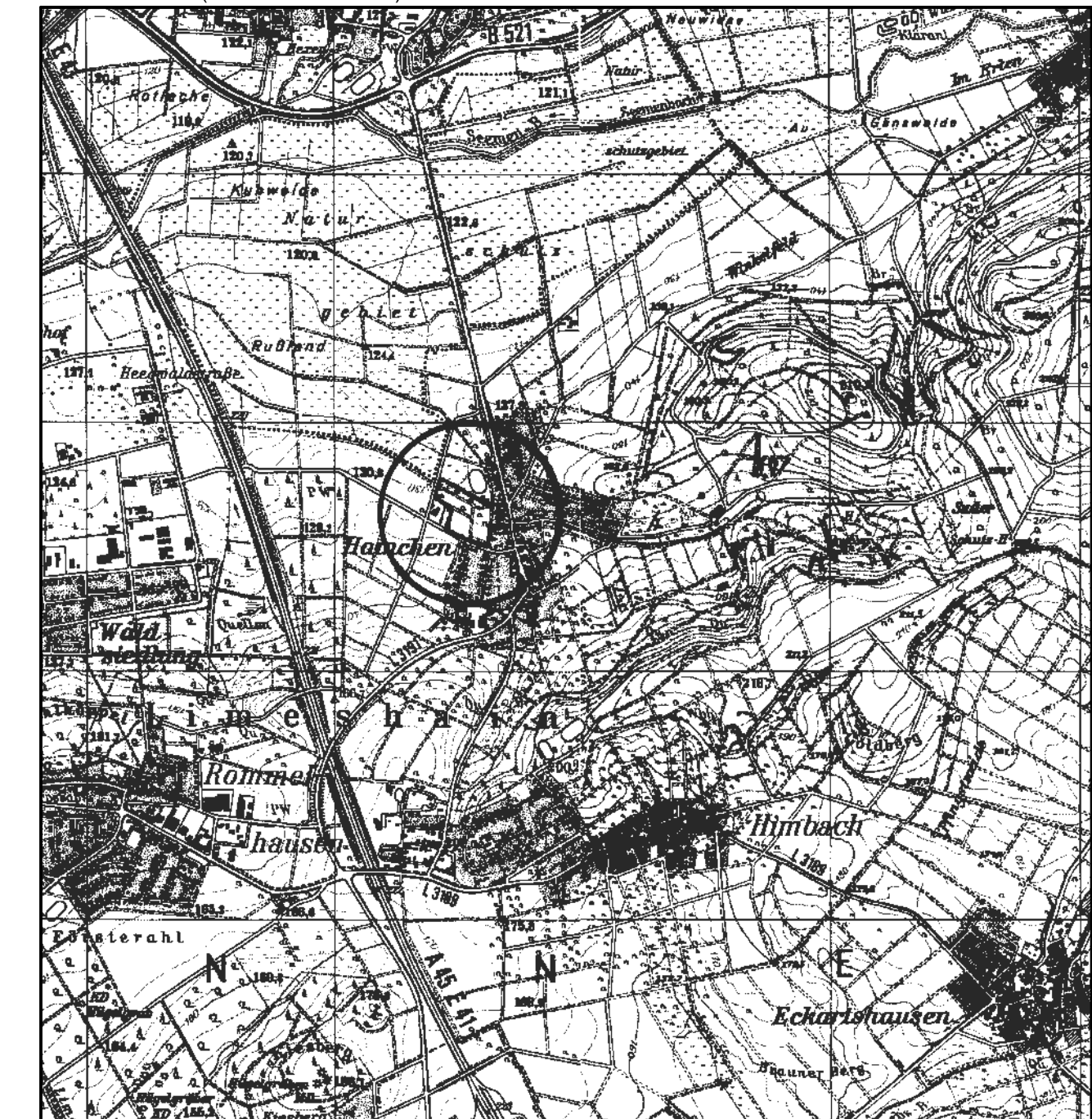
Übersichtskarte (Maßstab 1 : 25.000)